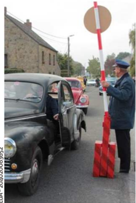
Le « Bouchon » de 2014 avait surpris et réjoui les participants. Il sera à nouveau organisé en mai 2018.

Lors de la fête de la ruralité 2014, Sautin avait vécu un « Bouchon » mémorable. Le club de Véhicules Anciens de Sivry-Rance (CVASR) y avait organisé une concentration record d'ancêtres, conduits par des amateurs en habits d'époque. Et pour que le public puisse les admirer à sa guise, il avait fomenté un contrôle douanier digne de « Rien à déclarer » pour créer un embouteillage des plus convivial. Le succès avait été au rendez-vous. Rien de plus logique donc, que de renouveler l'opération à l'occasion de cet anniversaire. Un « Bouchon 2 » est donc programmé le dimanche 27 mai autour de la Grand-Place de Sivry. L'événement n'est pas réservé qu'aux propriétaires de véhicules anciens. Le public est en effet le bienvenu dès 8 h 30 pour admirer les véhicules en exposition jusqu'à leur départ pour une première boucle d'une vingtaine de km à 11 h. Et chacun est invité à se vêtir en habits « vintage », histoire de parfaire l'ambiance correspondant à ces véhicules d'une autre époque. Le repas de midi est également ac-